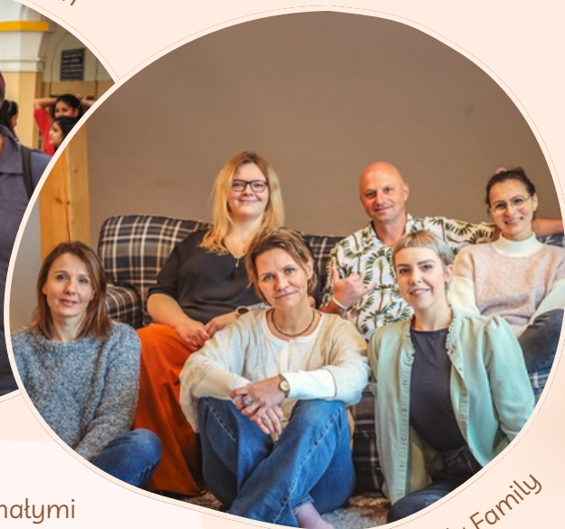
MOMA Ayurveda Family

Dzisiaj współpracujemy z małymi manufakturami w Indiach, skąd sprowadzamy naczynia, biżuterię i akcesoria z miedzi - tworzone ręcznie i z dbałością o szczegóły.